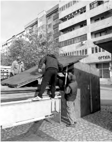
Punctul de atracție, în această perioadă, este platoul din fața Casei de

Și nu este singura veste bună. Cei care vor să viziteze târgul de Crăciun, pot admira și luminile de Crăciun.